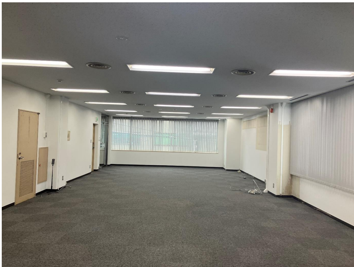
○4F貸室 ※アコーディオンカーテンは撤去予定です